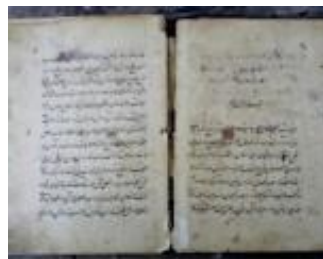
Извлечение Гаджи Сулеймана Иреванского «Полезьа мудрости»

Из произведений отдельных авторов, статистических данных того времени и архивных документов можно получить довольно много сведений о положении науки и образования в городе Иреван. И в период ханств, и в период российского завоевания ханы, беки, вельможи, религиозные деятели уделяли особое внимание тому, чтобы их дети получили превосходное образование. Многие состоятельные семьи посылали своих детей на учебу в зарубежные светские или высшие религиозные учебные заведения. Так