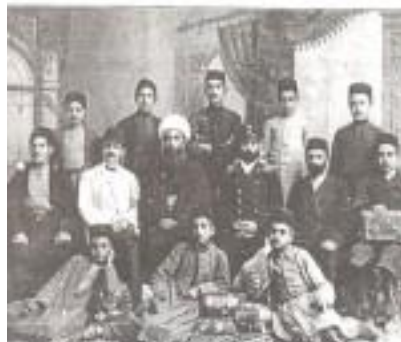
Группа преподавателей и учеников Иреванской гимназии

Этот великий человек обладал глубокими религиозными знаниями. Фазил Иревани в течение всей жизни усердно трудился на пути распространения исламского просвещения и написал ценные книги. В источниках упоминается примерно 15 книг, принадлежащих его перу. Особенно известны следующие книги Фазила Иревани: «Комментарии к толкованию Бейзави», «Иджтихад и таклид», «Усулুল-фикх», «Истисхаб», и т.д.