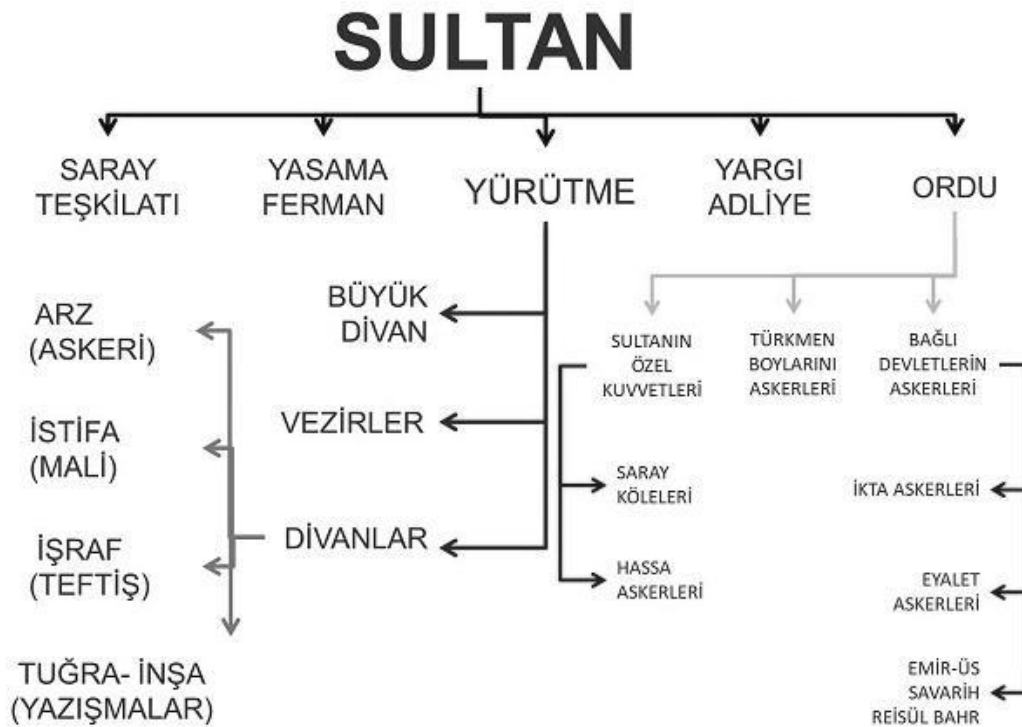
Dövlət təşkilatlarının strukturuna aid sxem

Əksər Səlcuq sultanları, həqiqətən də, xalq arasında “Əl-Sultan ül-Adil” (adil hökmdar) deyə adlandırılmış, mənbələr onlar haqqında ədalət mücəssəməsi kimi bəhs etmişlər.