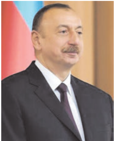
Azərbaycan Respublikasının Prezidenti İlham Əliyevin Dünya Azərbaycanlılarının Həmrəyliyi Günü və Yeni il münasibətilə müraciəti