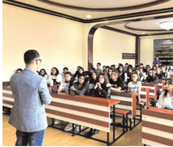
təlimin sonunda tələbələrin diqqətini yoxlamaq üçün maraqlı oyun keçirilib.