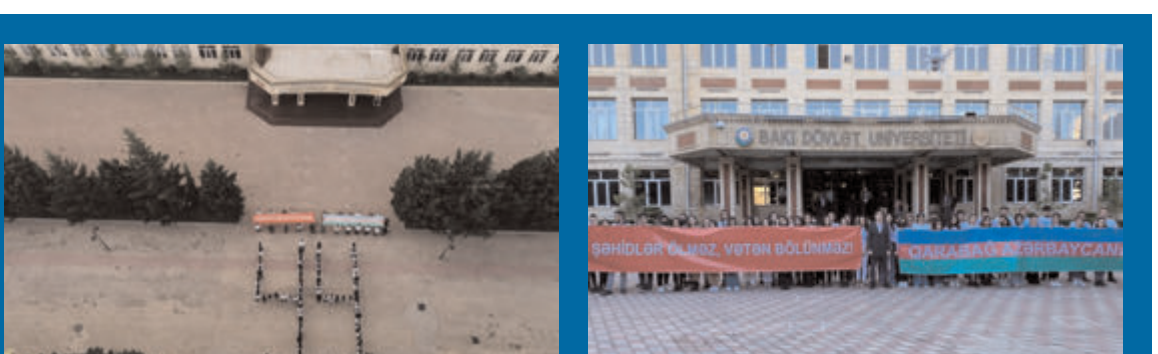
BDU THİK Vətən müharibəsində Zəfərə həsr olunan fləşmob keçirib