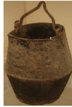
Şəkil 2. Mill Azərbaycan Tarixi Muzeyinin kolleksiyasından tartal