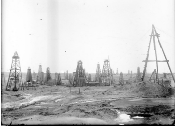
Şəkil 1. Mill Azərbaycan Tarixi Muzeyi Neqativ fondu. Balaxanıda neftçixarma mədənləri.