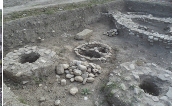
Şabranda arxeoloji qazıntılar zamanı aşkar edilən təndirxanalar