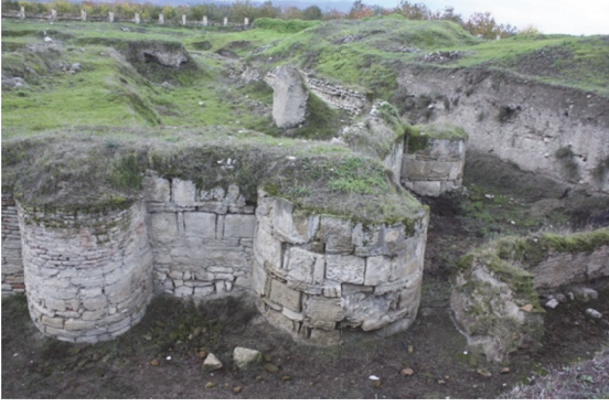
Şabranın qəsr divarları