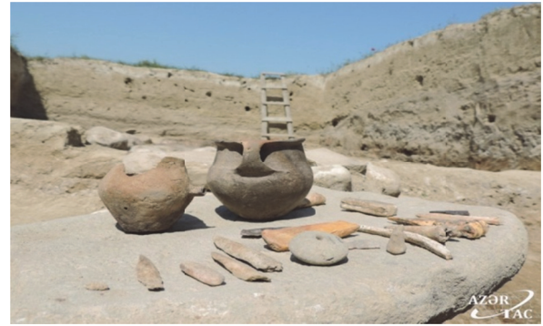
Çaqqalıqtəpədən tapılan maddi- -mədəniyyət nümunələri

Nəticə. Beləliklə, Şabran şəhərinin arxeoloji maddi-mədəni irsinin öyrənilməsi və tədqiqatlara cəlb edilməsi yeni arxeoloji tapıntıların meydana gəlməsinə şərait yaratmışdır. Eyni zamanda həmin arxeoloji materialların tədqiqi gələcəkdə Şabran şəhərinin maddi irsinin formalaşmasına öz müsbət töhfəsini verəcəkdir.