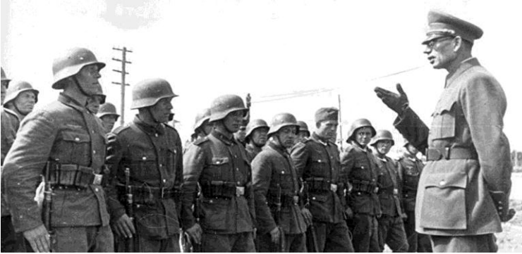
General Andrey Vlasov və “Rus Azadlıq Ordusunun” əsgərləri.