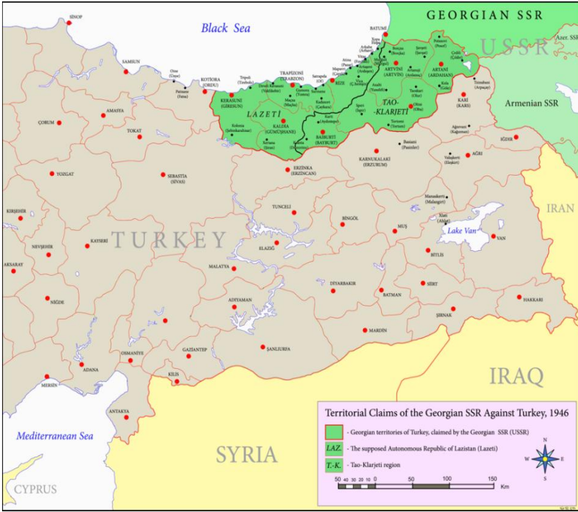
Gürcüstan SSR-nin Türkiyədən tələb etdiyi ərazilər

Sovet tələblərində “erməni məsələsinin” yeri. Ermənistan SSR-in tələbləri. Türkiyə tarixinə nəzər yetirdikdə məlum olur ki, hər hansısa dövlət Türkiyəyə qarşı sanksiya tətbiq edəndə ilk olaraq erməni məsələsini qaldırır. “Məzlum” xalq adıyla özünü dünyaya tanıdan ermənilər tarix boyu Türkiyəyə düşmən olmuşdur. Bildiyimiz kimi I dünya müharibəsinin sonunda Osmanlı İmperiyası da ləğv edildi. Onun yerində yaranan Türkiyə ilə Rusiya arasında 1921-ci ildə imzalanmış Moskva və Qars müqaviləsinə əsasən, bu gün də qüvvədə olan sərhədlər müəyyənləşdirildi (13).