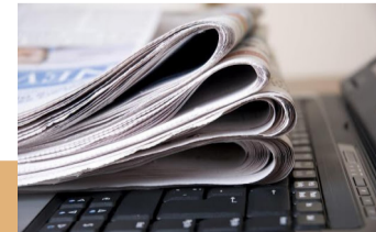
3 may Beynəlxalq Mətbuat və Söz Azadlığı Günüdür