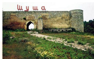
Qarabağın incisi Şuşa