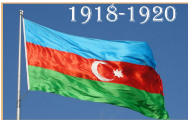
Azərbaycan Respublikası Azərbaycan Xalq Cümhuriyyətinin varisidir