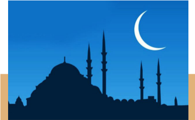
On bir ayın sultanı - Ramazan