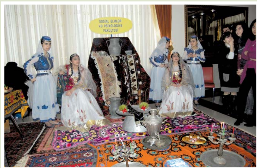
Fakültənin tələbələri Novruz şənliyində