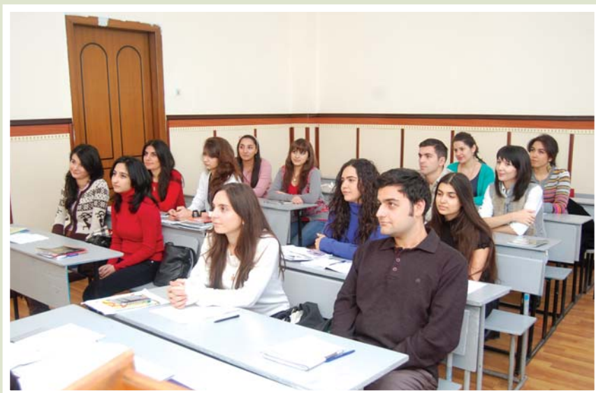
Fakültə tələbələri dərstdə