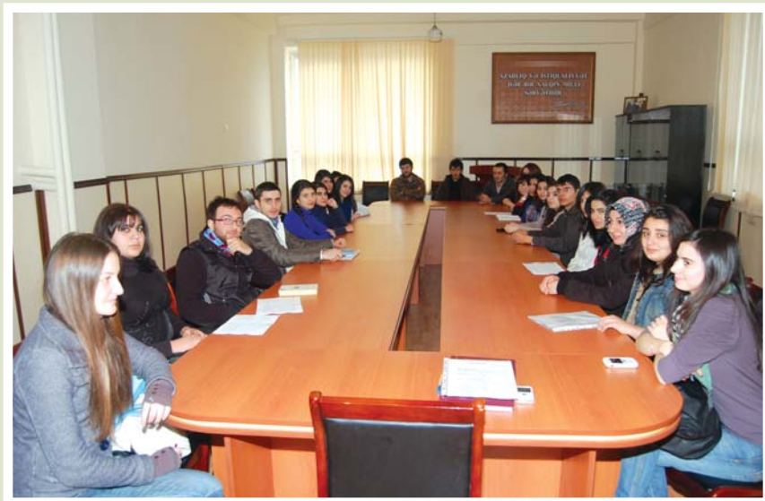
Fak lte t l b ləri m zakir  zamanı