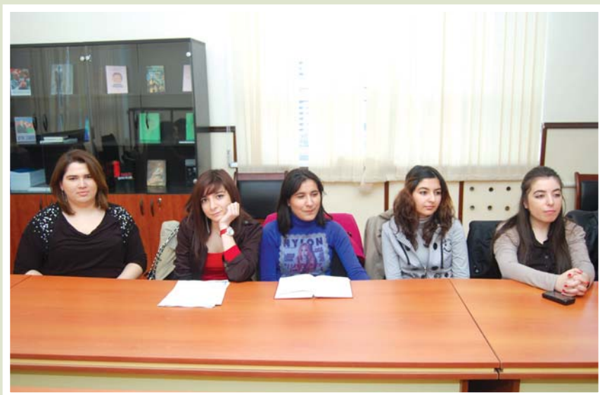
Fakültə tələbələri müzakirə zamanı