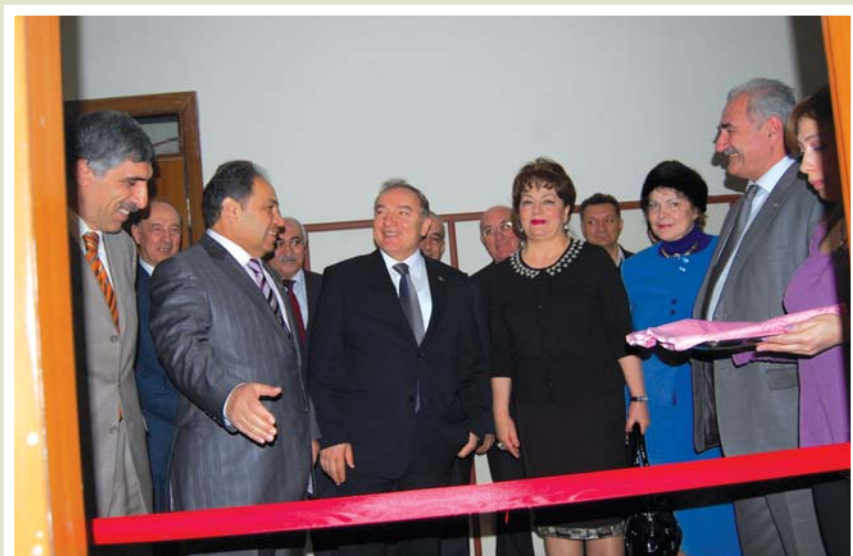
BDU-nun rektoru, millət vəkili, akademik A.M.Məhərrəmov və Türkiyə Respublikasının Fövqəladə və Səlahiyyətli Səfiri Hülüsi Kılıc fakültədə kompüter mərkəzinin açılışında