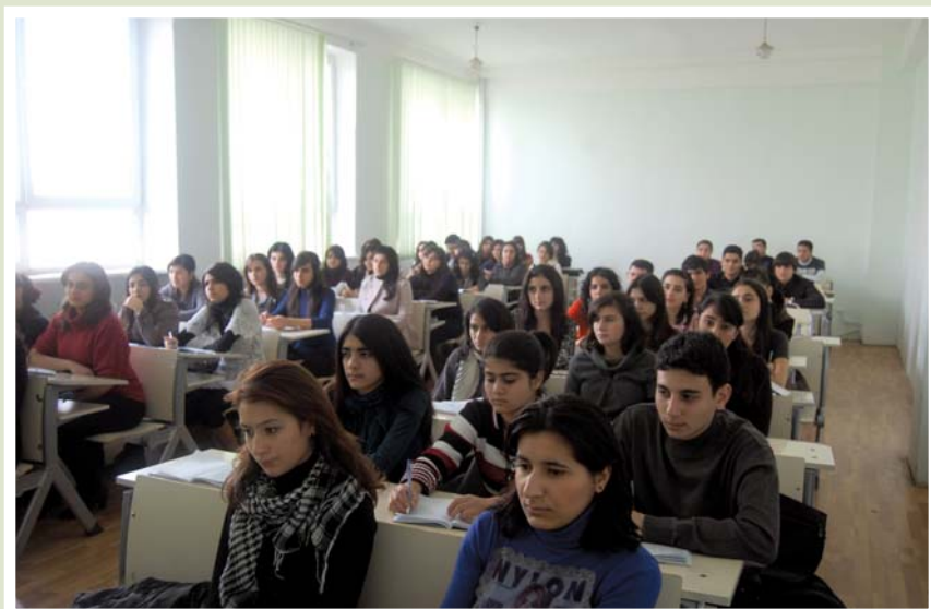
Fakülte tələbələri dərslər zamanı