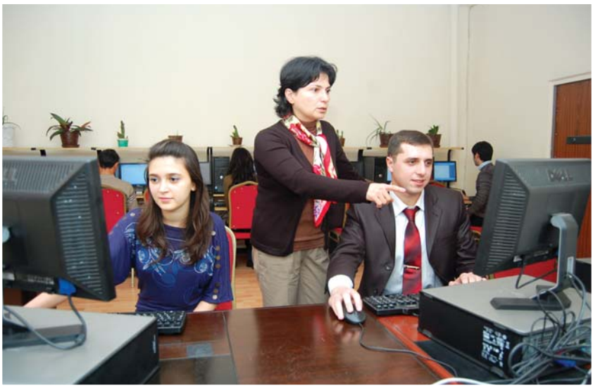
Magistr tələbələr İnformatika dərbində