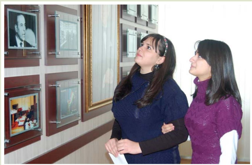
Fakültə tələbələri ümummilli lider Heydər Əliyevin həyat və fəaliyyətini əks etdirən guşədə